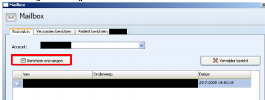
Afbeelding 3. Ontvangen berichten

[Bericht koppelen aan patiënt] > [Kiezen patiënt] > [Toevoegen aan het patiëntdossier] > bericht wordt toegevoegd aan patiëntendossier en vervolgens verwijderd in de mailbox queue.