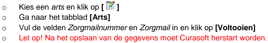
Afbeelding 1. Instellen ontvangers